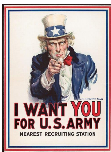
Рис. 2. Плакат «Uncle Sam»