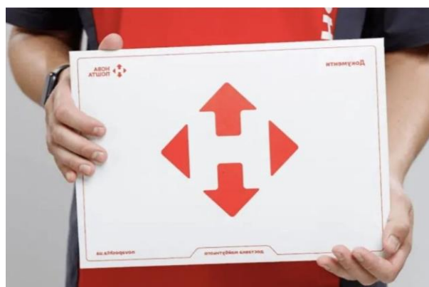
Рис. 3. Пакування Нової Пошти

Синьо-жовтий кольори мають особливе значення у контексті національної символіки України, де синій символізує чисте небо, а жовтий – родючі поля пшениці. Після 2014 року і особливо після 2022-го ця палітра стала брендом України, що втілює у собі свободу, боротьбу, єдність та силу. Її активно інтегрують у міжнародні та українські проекти, щоб висловити підтримку країни та зазначити власну політичну позицію. Після повномасштабної агресії з боку Російської Федерації американська транснаціональна корпорація Google інтегрувала синьо-жовту гаму на головній сторінці вебресурсу [3]. Інститут кольору Pantone виділив кольори українського прапора на знак підтримки українців [4].