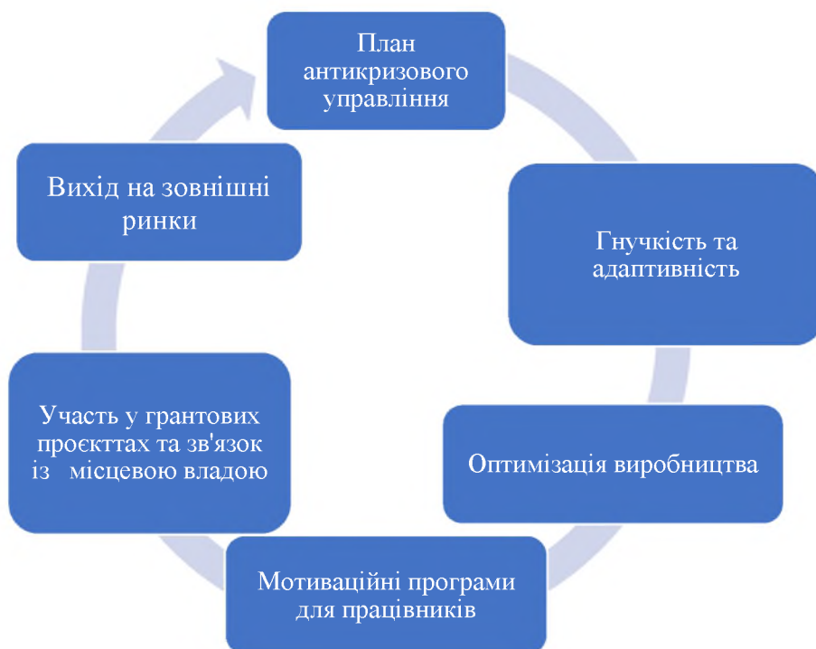
Рис. 2. Система напрямків та заходів тактичного управління вітчизняним підприємством

від вторгнення росії, та які перемістили свою діяльність в безпечні регіони. Понад 22 тис. підприємців отримали грантову підтримку з боку USAID [3].